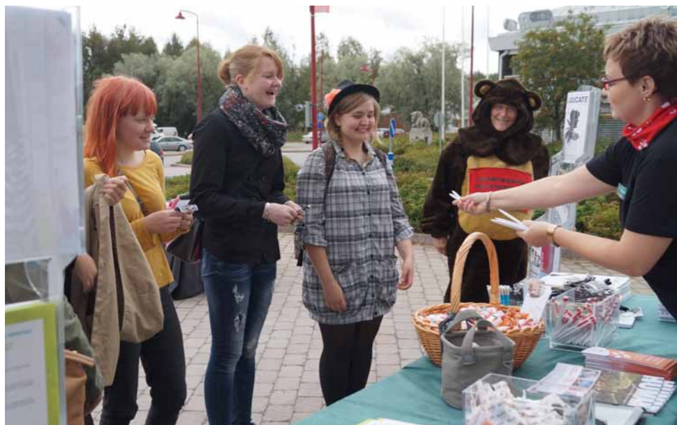
Opiskelu - vaihtoehto talviunille. Maakuntakorkeakoulu Karhu mielessä -festivaalilla Ilomantsissa.