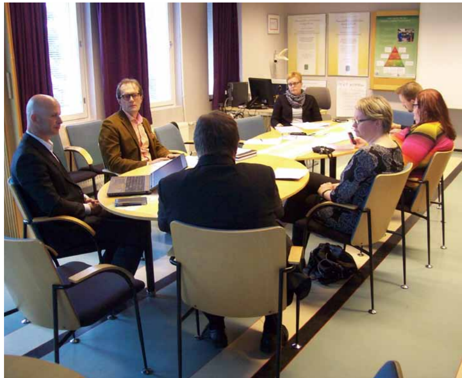
Maakuntakorkeakoulun Ylä-Karjalan työryhmä koolla Nurmeksessa.

Pohjois-Karjalan maakuntakorkeakoulun toiminta perustuu yhteistyöhön ja vahvaan verkostoon. Projektina vuonna 2006 alkanut toiminta on vakiintunut osaksi Karelia-ammattikorkeakoulua. Toimintaa koordinoi Karelia-ammattikorkeakoulun henkilöstöön kuuluva maakuntakorkeakoulukoordinaattori.