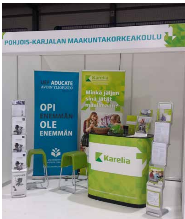
Pohjois-Karjalan maakuntakorkeakoululla oli oma osasto Pielisen Messuilla.

Mervi Leminen maakuntakorkeakoulukoordinaattori