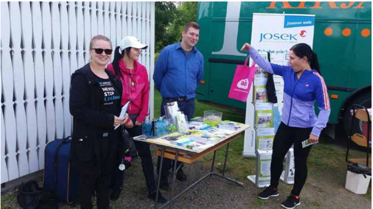
Avoimet korkeakouluopinnot tarjoavat mahdollisuuden joustavaan ja paikkariippumattomaan opiskeluun. Kuva on koulutustori-tapahtumassa Iilomantsista.

Tällä hetkellä on käynnissä avoimen amk:n sosionomipolkuopinnot. Lisäksi maakunnassa toteutettiin sosiaalialan ja informaatiotutkimuksen avoimia yliopisto-opintoja. Sosiaalialan opinnot järjestettiin Itä-Suomen yliopiston tutkinnon mukaisesti. Järjestäjinä toimivat Pohjois-Karjalan kesäyliopisto ja Nurmeksens lukio. Lisäksi Pohjois-Karjalan Kesäyliopistolla toteutettiin Informaatiotutkimuksen perus- ja aineopintoja (Oulun yliopiston tutkinnon mukaisesti).