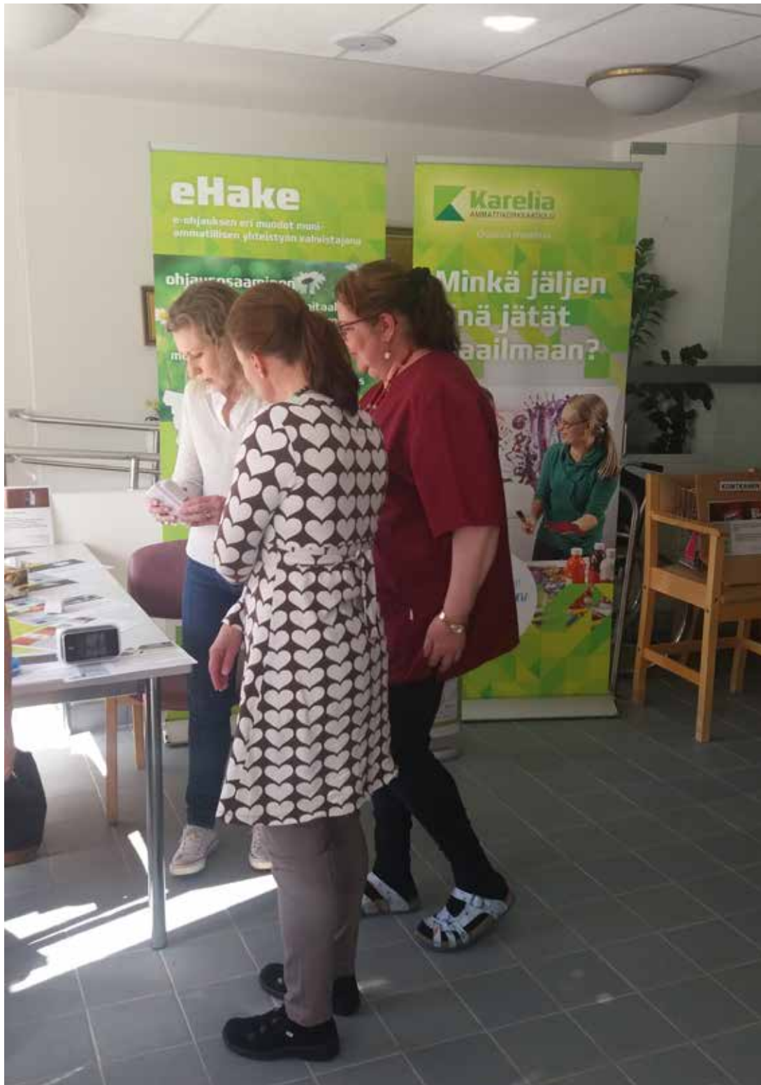
Karelia-amk:n terveystalon opettaja keskustelemassa Lieksan terveystalon henkilöstön kanssa ikäihmisille saatavilla olevista arjen apuvälineistä.