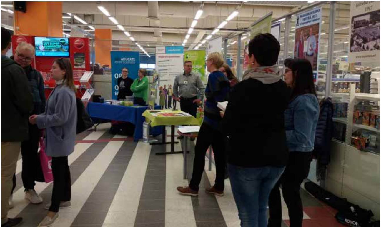
Koulutusohjaus jalkautui kauppakeskukseen Kiteellä.