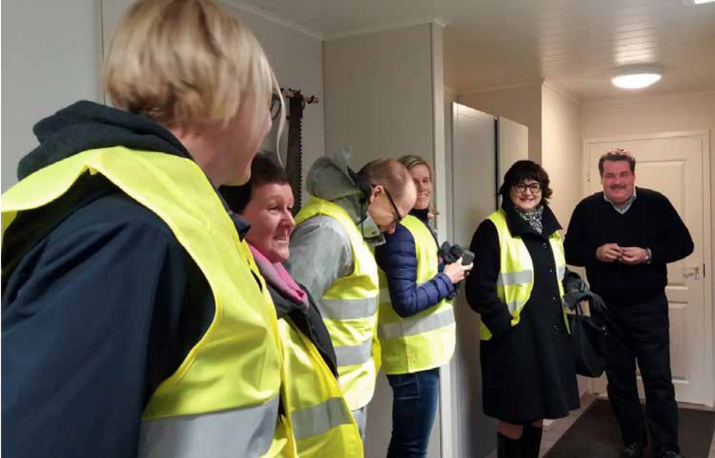
Maakuntakorkeakoulun Keski-Karjalan ohjausryhmän jäseniä koolla Kiteellä BioCone Oy:n toimitusjohtaja Mika Kärnän vieraana.